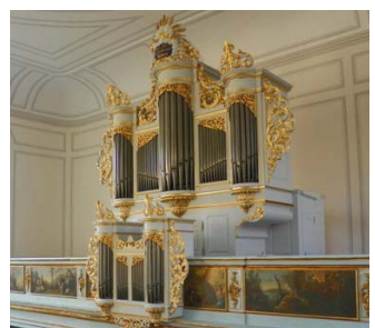
Orgue Silbermann (1718), Sainte Aurélie

Octave courte - Sélection ré # -mi b - Sélection sol # -la b Tempérament mésotonique Accouplement tiroir - Rossignol - Zimbelstern